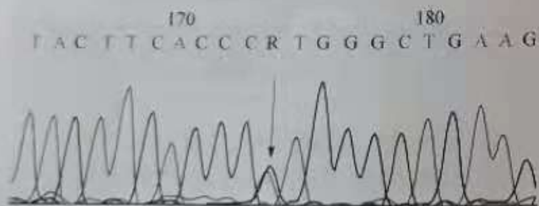
图1 TRPV4 基因 11 号外显子发生错义突变(c. 1781G>A)

例如,对上述 SMDK 患者家系中 II 2 、III 1 成员的 TRPV4 基因进行 Sanger 测序分析,结果如图 1,图中显示 TRPV4 基因 11 号外显子发生错义突变(c. 1781G>A) [6] 。该 Sanger 测序结果的呈现方式不属于中学阶段考生应具备的认知范畴,因此,利用该科研文献创设试题情境时,需依据此图作适当转化处理成如例题中 SMDK 患者家系各成员 TRPV4 基因的测序结果表,从而达到适切考生认知水平,减免测量干扰,提高试题效度。